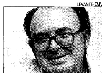
Vicent Andrés Estellés.

Otra es que el grueso de su producción llegó en los años 70 y eso ha hecho que un componente de su obra (el político) sobresalga mucho sobre el resto. Y otra, año-